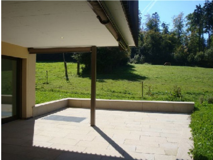
Vorplatz, Adlisbergstr. 92, 8044 Zürich

SinR = [[A \rightarrow I], [[A \rightarrow I] \rightarrow A], [[A \rightarrow I], \rightarrow A], [[[A \rightarrow I] \rightarrow A] \rightarrow I]]