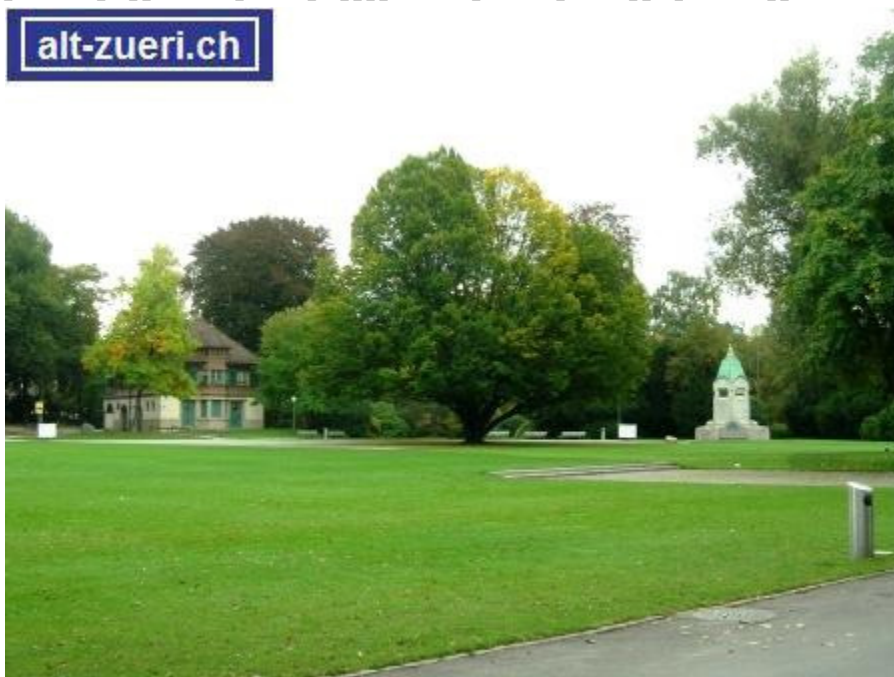
Offener Umgebungskonnex, Zürichhorn