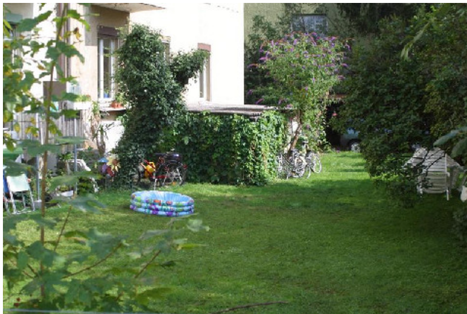
Grünfläche, Altstetterstr. 119, 8048 Zürich

QualR = [[[A → I], [A → I]], [[A → I], → A], [[[A → I] → A] → I]]