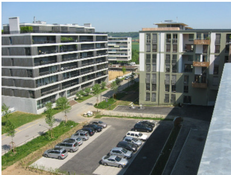
Parkplatz als Umgebung, Heinrich Wollfstr. 13, 8046 Zürich

LegR = [[[A \rightarrow I], [[[A \rightarrow I] \rightarrow A] \rightarrow I]], [[A \rightarrow I], \rightarrow A], [[[A \rightarrow I] \rightarrow A] \rightarrow I]]