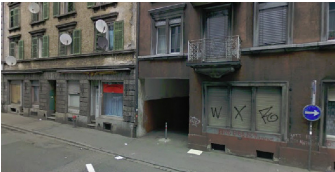
Zubringer zum Innenhof, Weststr. 136, 8003 Zürich

InRel = [[A \rightarrow I], [[[A \rightarrow I] \rightarrow I], [[A \rightarrow I] \rightarrow A], [[[A \rightarrow I] \rightarrow A] \rightarrow I]]]