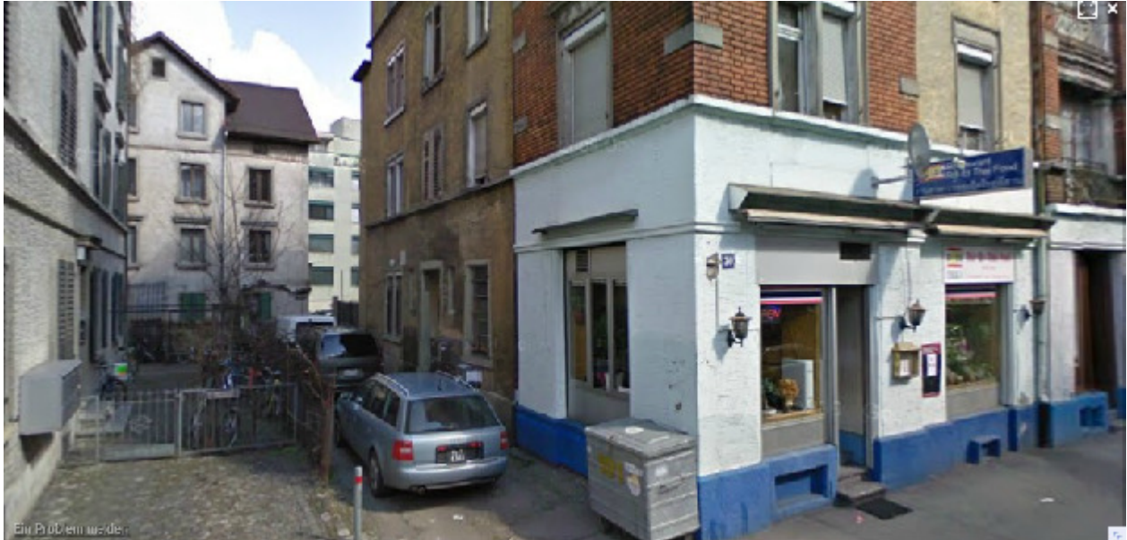
Lücke/Zugang/Einfahrt als symbolisches Nullzeichen, Schöneggstr. 30, 8004 Zürich

SyRel = [[A \rightarrow I], [[[A \rightarrow I] \rightarrow A], [[[A \rightarrow I] \rightarrow A] \rightarrow I]], [[[A \rightarrow I] \rightarrow A] \rightarrow I]]