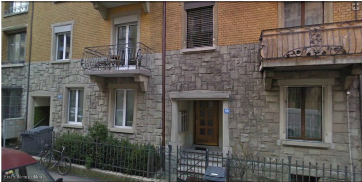
Nahtlos aneinander gebaute Zwillingshäuser, Pflanzschulstr. 57/59, 8004 Zürich

IcRel = [[A \rightarrow I], [[[A \rightarrow I] \rightarrow I], [A \rightarrow I], [[[A \rightarrow I] \rightarrow A] \rightarrow I]]]